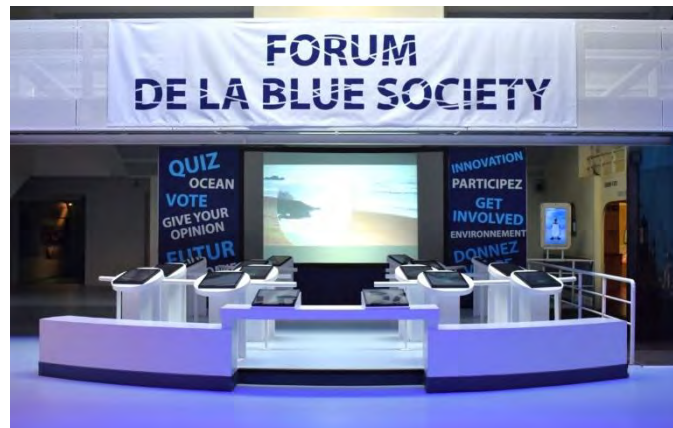
Forum de la Blue Society au cœur de NAUSICAA

**NAUSICAA touche chaque année plus d'un million de visiteurs. Le public de notre Centre représente un échantillon pertinent pour vos études de marché. Sur 24 000 visiteurs interrogés :